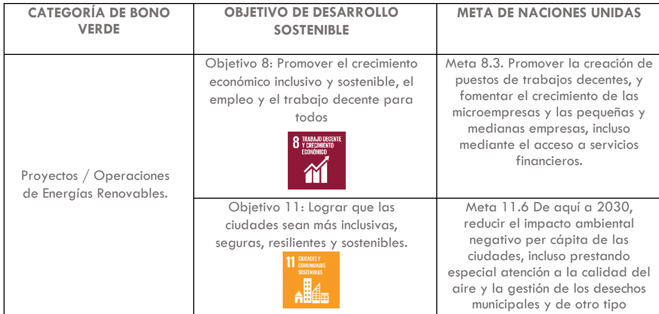
Tabla 2: Análisis del impacto – ODS colaterales

Por otro lado, se ha reconocido una contribución colateral al ODS 8. Trabajo Decente y Crecimiento Económico y al ODS 11. Ciudades y Comunidades Sostenibles. También se han precisado las metas específicas de Naciones Unidas 8.3. Promover la creación de puestos de trabajos decentes; y 11.6. Reducir el impacto ambiental negativo per cápita de las ciudades, incluso prestando especial atención a la calidad del aire; las cuales, si bien no están en el core de la operación de la PHR, se considera que existirá una contribución positiva y favorable para los grupos de interés.: